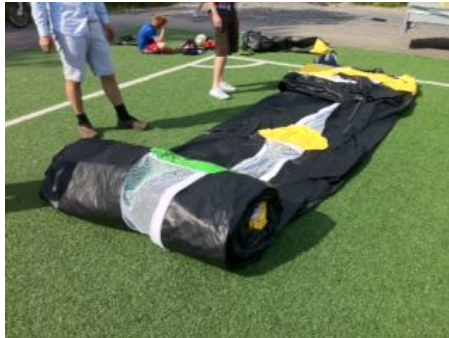
Rull ut på bane