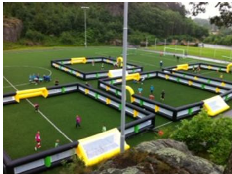
4 baner i Kristiansand utendørs