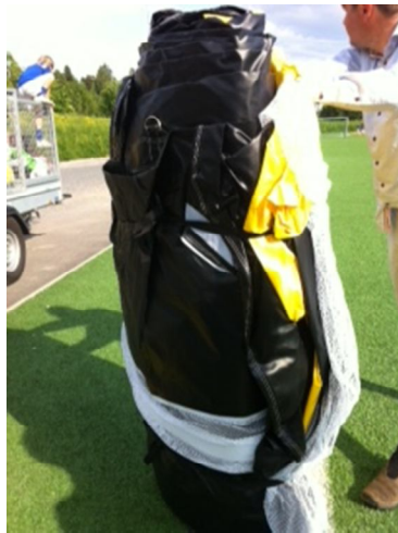
På høykant etter at sekk er trukket av første gang