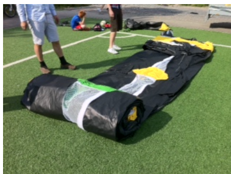
Rull ut på bane