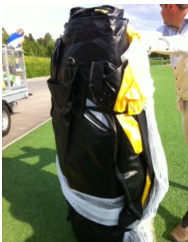
er trukket av første gang